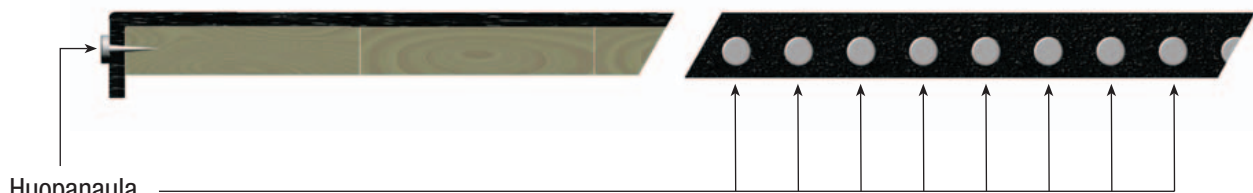
Huopanaula 25 mm välein (sekä pääty- että sivuräystä)